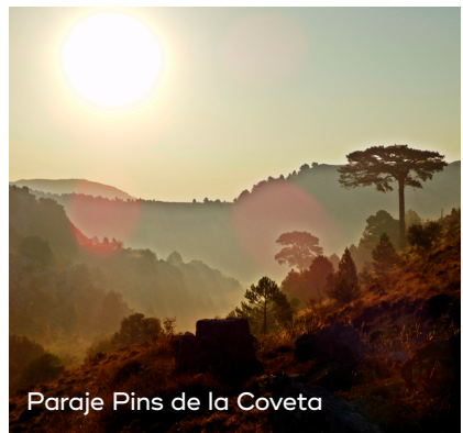
Paraje Pins de la Coveta

Castell de Cabres est la porte d'entrée de la Tinença de Benifassà. Entourée de vallées et de montagnes, elle jouit d'un environnement naturel idéal pour se ressourcer au contact de la nature. De plus, cette commune se caractérise par sa tranquillité et par une offre intéressante de tourisme rural, qui permet de profiter d'une ville dans laquelle le temps semble figé.