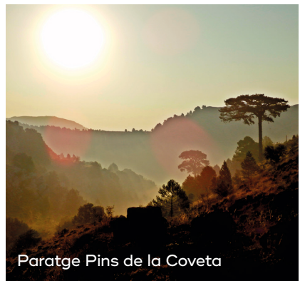
Paratge Pins de la Coveta

Castell de Cabres és la porta d'entrada a la Tinença de Benifassà. Envoltat de valls i muntanyes, el seu entorn natural és ideal per a deixar-se embolicar per la naturalesa. A més, aquesta localitat destaca per la seua tranquil·litat i per disposar d'una interessant oferta de turisme rural, que permet gaudir d'un poble en el qual el temps sembla congelat.